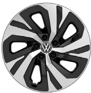
Di serie su City

Cerchi in lega FALUN 8J x 18" con pneumatici 235/55 R19 101T superficie diamantata silver/nero e sistema antiforatura AirStop®