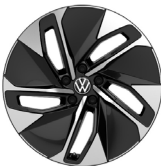
Di serie su Life, Business, Tech

include bulloni ruote con sistema antifurto