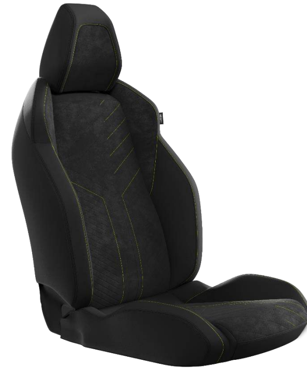
TEP / Alcantara® Mistral ICONIUM, cuciture Verde Adamite e Tramontane