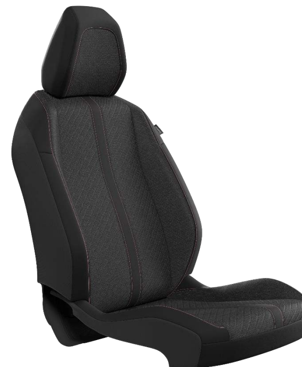
Tessuto/TEP CASUAL LOMSA, cuciture Quartz