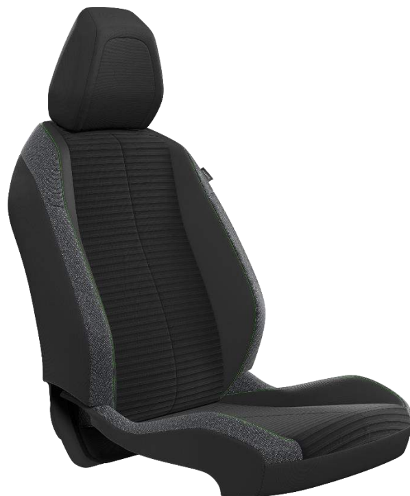
Tessuto PNEUMA 3D, cuciture Calcite