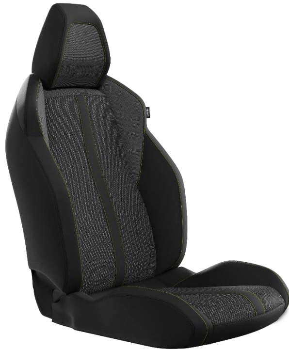
Tessuto/TEP BELOMKA, cuciture Verde Adamite